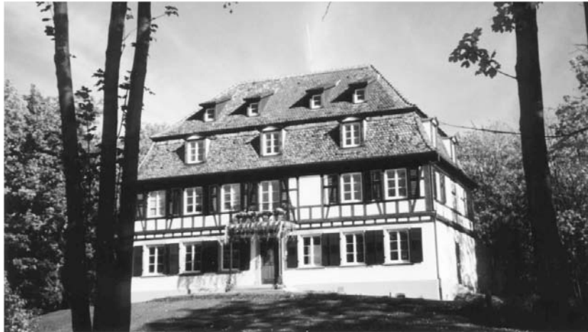
Le siège de l'Institut international des droits de l'homme