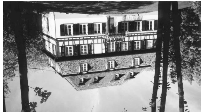
The seat of the International Institute of Human Rights